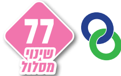
איזור שינוי קו 77

לכיוון הגבעה הצרפתית: הקו ייסע במסלול הרגיל ברחוב עמק רפאים עד לצומת רחל אימנו, ומשם ימשיך דרך הרחובות רחל אימנו, כובשי קטמון, כ"ט בנובמבר, דובנוב ואלחנן. לא יעבור בחלקו הצפוני של רחוב עמק רפאים. לכיוון מלחה: הקו ייסע במסלול הרגיל ברחוב עמק רפאים עד לצומת רחל אימנו, ומשם ייסע דרך הרחובות רחל אימנו ואלעזר המודעי בחזרה לצומת אורנים.