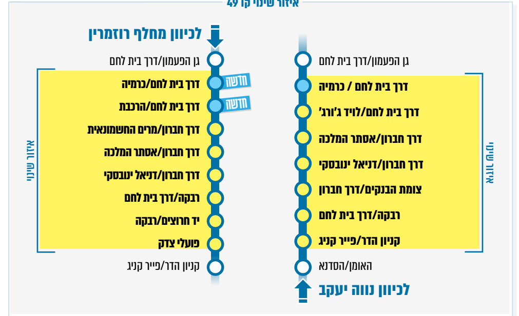
איזור שינוי קו 49

לכיוון נווה יעקב: הקו ייסע במסלול מקוצר, ישירות מרחוב האומן לקניון הדר. התחנות ברחובות הסדנא, יד חרוצים ופועלי צדק - יבוטלו. לכיוון מחלף רוזמרין: הקו ייסע מרחוב רבקה דרך הרחובות יד חרוצים ופועלי צדק וישוב למסלול הרגיל מקניון הדר עד מחלף הרוזמרין